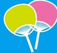
少しの風で 体感温度がちがいます