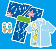
夏らしく 涼しげな服を