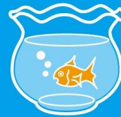
涼しげなものを お部屋にひとつ