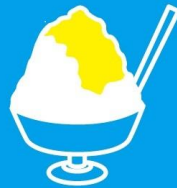
目にも涼しく 体にひんやり